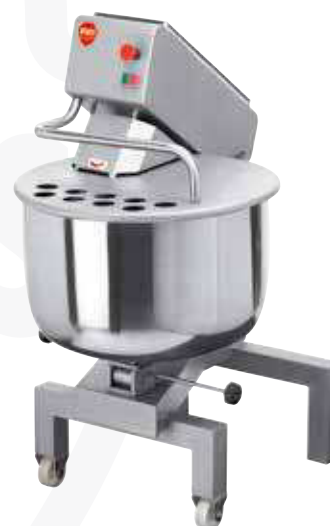
Abb. DMM 90 V

Auch verfügbar ohne separaten Schüsselantrieb als DMM 60 V oder auch in der größeren Ausführung DMM 90 VM und DMM 90 V